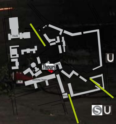
Installation Cow Shed/ Blakiian Shak 7hours HAUS 19, 2005

HAUS 19 Reinhardtstr. 18 - 20 und Reinhardtstr. 4 Philipppstr. 13