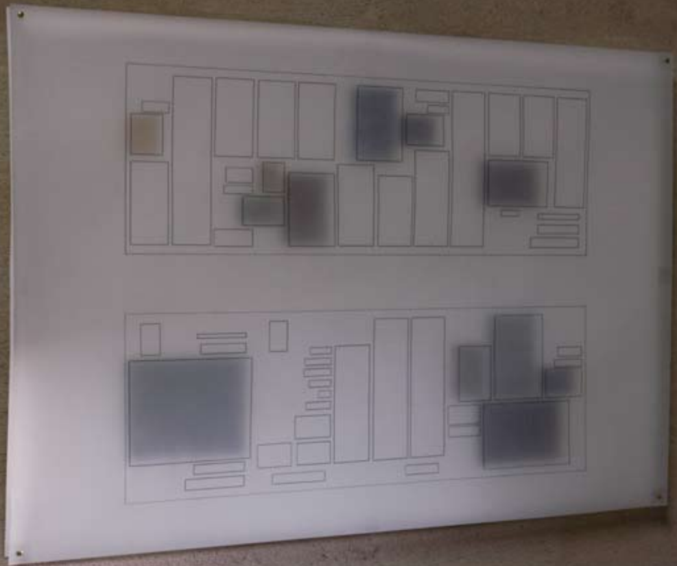
o.T. ( ) 59,6 cm x 84,2 cm, Graphit auf Transparentpapier, Wasserfarbe auf Papier, signiert)