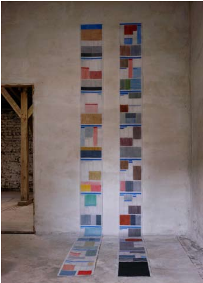
o.T. (Kunstzeitung 06_2009/I) und o.T. (Kunstzeitung 06_2009/II) je 470cm x 32 cm, Graphit, Aquarell auf Transparentpapier, signiert Dyptichon